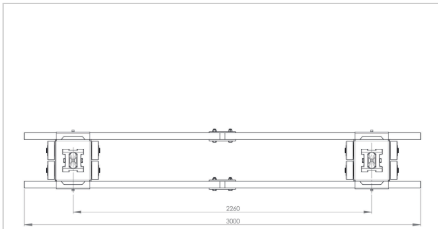
JFB 30 G TL | Art.No. 10 302 140-TL | Draufsicht | Top view